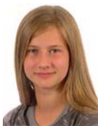
Reisch, Franziska Dollinger-Realschule