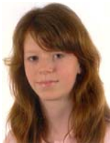
Kopf, Saskia Wieland-Gymnasium