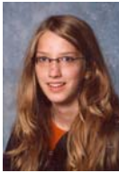
Chavillie, Marie Pestalozzi-Gymnasium